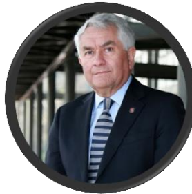
Health Minister Enrique Paris