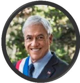
President of Chile Sebastián Piñera