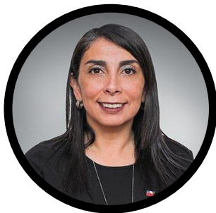
Minister of Social Development and Family Karla Rubilar