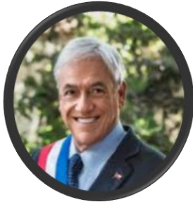
Presidente de La República Sebastián Piñera