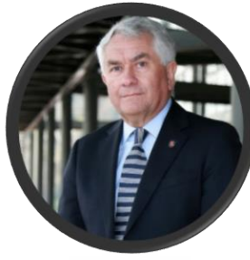
Ministro de Salud Enrique Paris