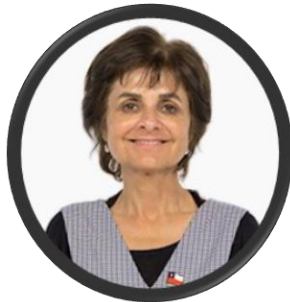
Subsecretaria de Salud Paula Daza