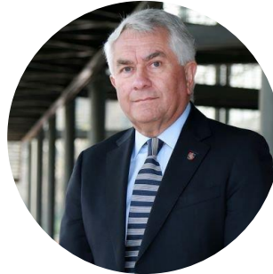
Ministro de Salud Enrique Paris