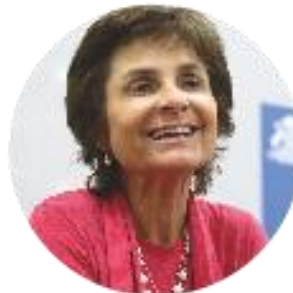
Subsecretaria de Salud Paula Daza