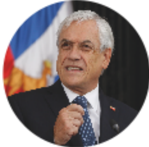
Presidente de la República Sebastián Piñera