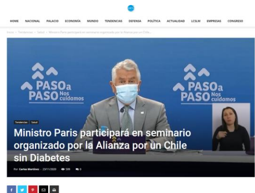
La instancia es abierta al público y se transmitirá el miércoles 25 de noviembre a las 18:00 a través del canal de YouTube de la CIF y contará con la participación del ministro de Salud, Enrique Paris.