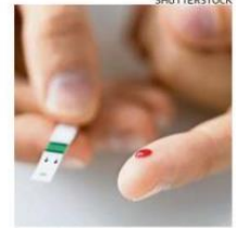
La diabetes es otra pandemia.

Este miércoles se realizará el seminario Diabetes y Covid-19: La suma de dos pandemias, organizado por la Alianza por un Chile sin diabetes. La instancia, abierta al público, contará con el ministro de Salud, Enrique París y se transmitirá a las 18:00 horas por EmolTV y el canal de YouTube de la Cámara de Innovación Farmacéutica. En la cita se analizará cómo bajar el impacto que ocasiona la suma de ambas pandemias, las estrategias para recuperar el diagnóstico y control de pacientes, y cómo enfrentar la pandemia de diabetes invisibilizada. Habrá además una exposición de