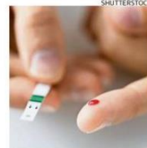
La diabetes es otra pandemia.

Este miércoles se realizará el seminario Diabetes y Covid-19: La suma de dos pandemias, organizado por la Alianza por un Chile sin diabetes. La instancia, abierta al público, contará con el ministro de Salud, Enrique París y se transmitirá a las 18:00 horas por EmolTV y el canal de YouTube de la Cámara de Innovación Farmacéutica. En la cita se analizará cómo bajar el impacto que ocasiona la suma de ambas pandemias, las estrategias para recuperar el diagnóstico y control de pacientes, y cómo enfrentar la pandemia de diabetes invisibilizada. Habrá además una exposición de