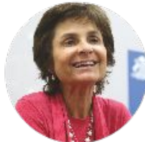
Subsecretaria de Salud Paula Daza