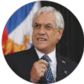
Presidente de la Republica Sebastián Piñera