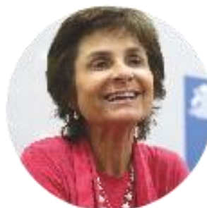
Subsecretaria de Salud Paula Daza