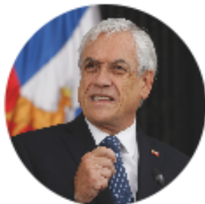
Presidente de la Republica Sebastián Piñera