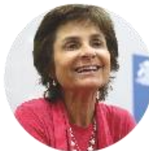
Subsecretaria de Salud Paula Daza