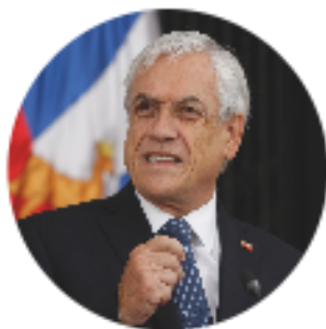
Presidente de la Republica Sebastián Piñera