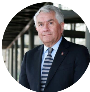
Ministro de Salud Enrique Paris