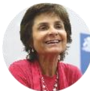
Undersecretary of Health Paula Daza