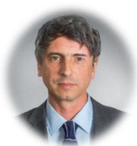
Ministro de Ciencia Andrés Couve