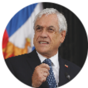
President Of Chile Sebastián Piñera