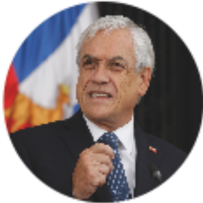
Presidente de la Republica Sebastián Piñera