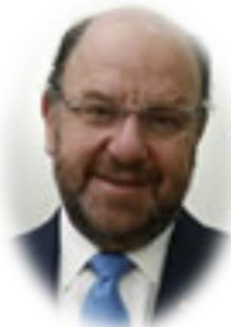
Minister of Public Works Alfredo Moreno