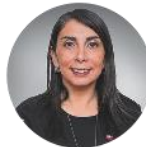
Ministra Secretaria General de Gobierno Karla Rubilar