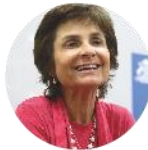
Subsecretaria de Salud Paula Daza