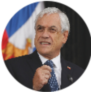
Presidente de la República Sebastián Piñera