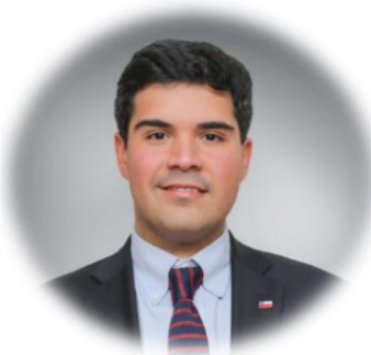
Ministro de Bienes Nacionales Julio Isamit