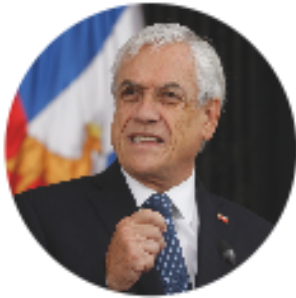
Presidente de la República Sebastián Piñera