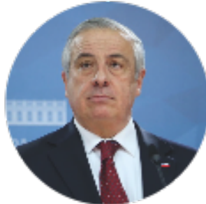
Ministro de Salud Jaime Mañalich