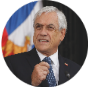
Presidente de la República Sebastián Piñera