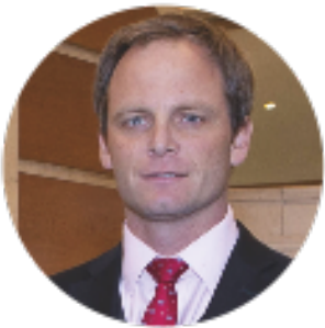
Subsecretario de Redes Asistenciales Arturo Zúñiga