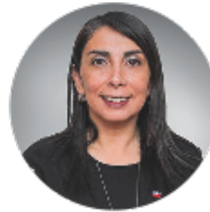
Ministra Secretaria General de Gobierno Karla Rubilar